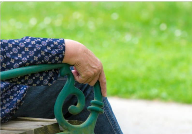
Vorsorge & Lebensende