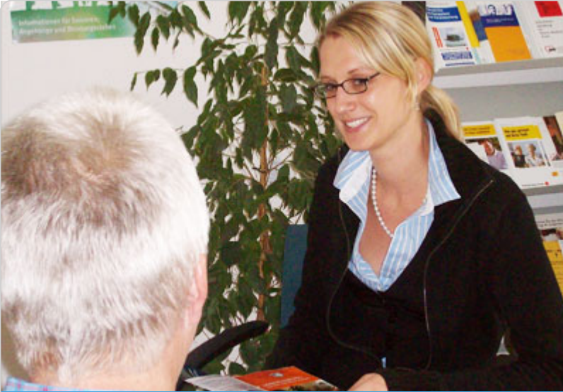
Beratung & Gesundheit