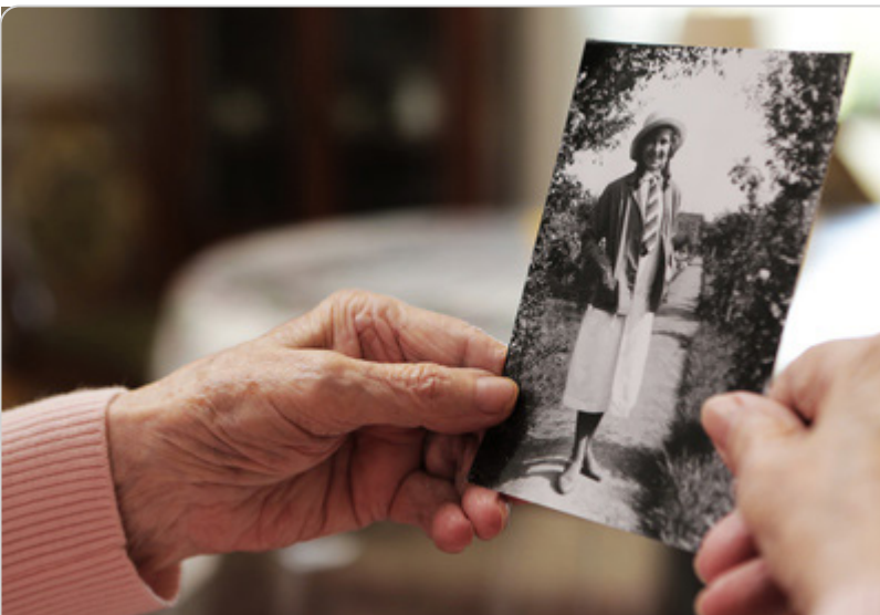
Leben mit Demenz